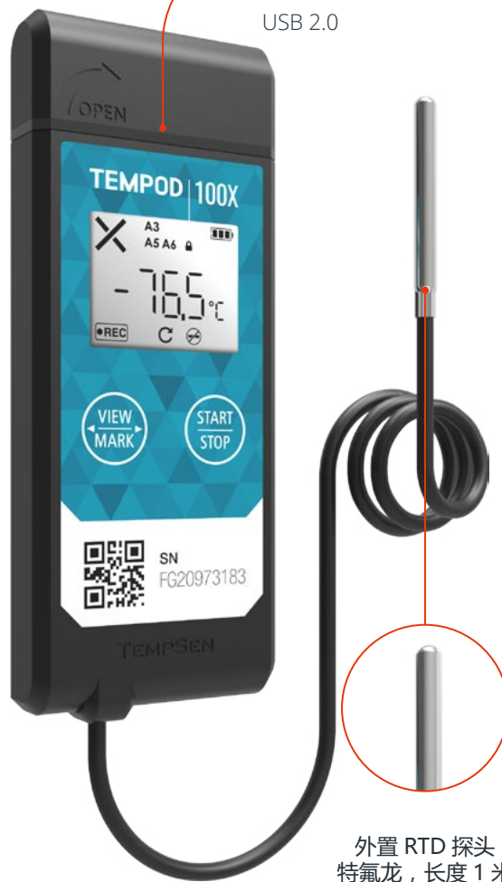
外置 RTD 探头 特氟龙，长度 1 米